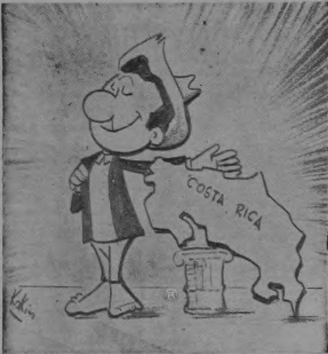
...por ti conocerán a nuestra Patria!