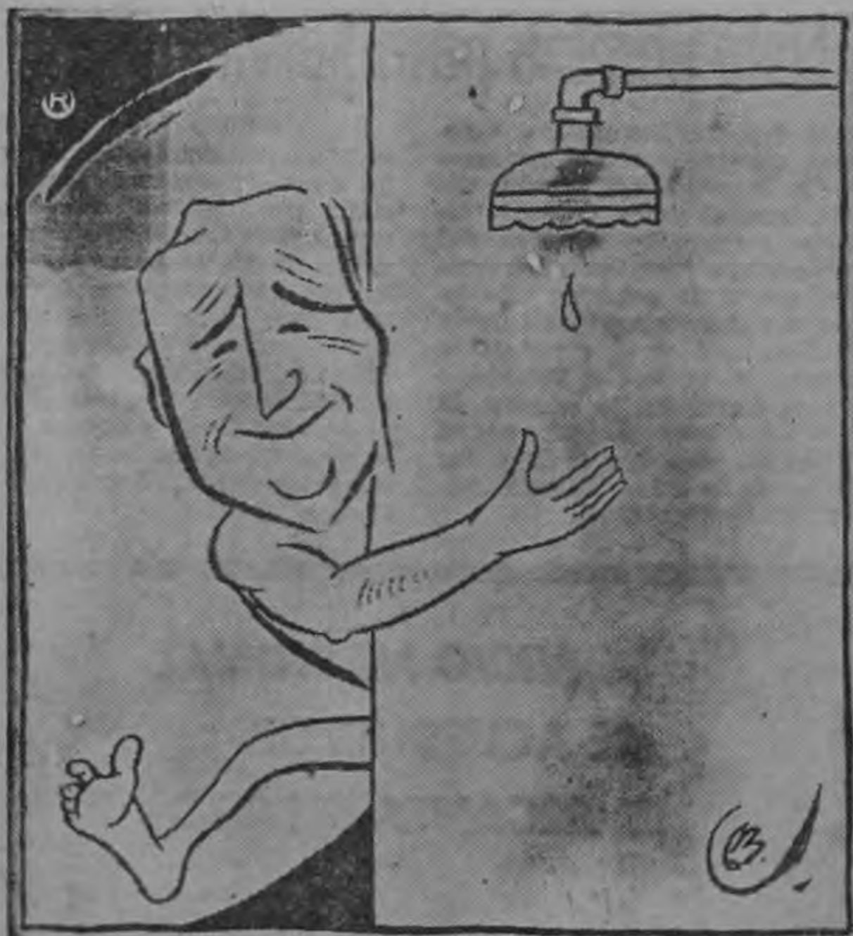
DON LILITO: ¡Al agua! ¿Pero dónde está el agua, si vu plé?