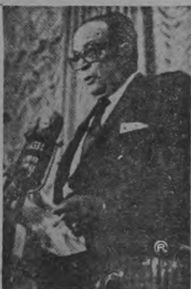
MIRO CARDONA...sorpresivamente fue a Guatemala...

GUATEMALA, 8. AP— José Miró Cardona, jefe del Consejo Revolucionario Cubano, se entrevistó ayer con el presidente Miguel Ydígoras y con el canciller Jesús Uda Murillo, según informó El Imparcial, basando la noticia en fuentes oficiales.