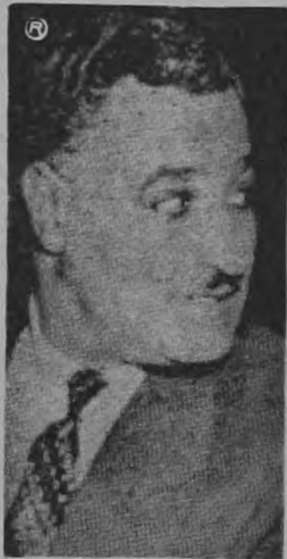
NASSER ...propicia rebelión en Siria...

"El Presidente Moise Tshombe fue a ver a Lumumba (después de su captura) y luego convocó a una reunión de gabinete para convenir en que el ex primer ministro fuera procesado y que en el interín fuera encarcelado en Bunkeya, población natal del ministro del interior Munongo. Pero al término de la sesión los ministros celebraron la captura de su enemigo con copiosas libaciones. La misma noche, Munongo y Kibwe fueron al lugar donde permanecía el prisionero para insultarlo. Lumumba, que había llegado a Elisabethville en un estado de postración, no tenía ya capacidad para reaccionar. Fue entonces que Munongo y Kibwe, completamente borrachos, ultimaron alevosamente a Lumumba después de someter a la misma suerte a ministros de su ventudes del gobierno central, M. Mpoko, y al vicepresidente del gobierno."